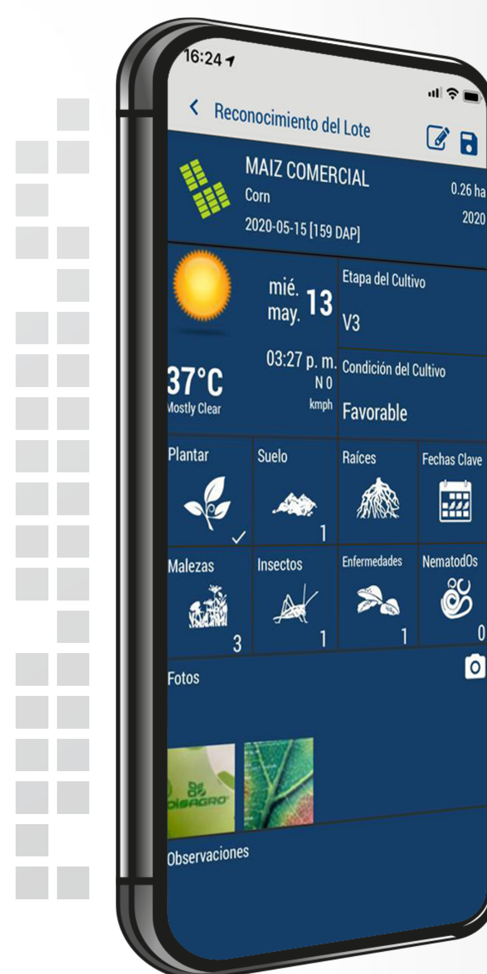
Función de reconocimiento de lote dentro de AgritecGEO®

De otra parte, el servicio de clima inteligente suministra el pronóstico del clima y además alerta al agricultor en el momento en el que las condiciones meteorológicas que se están presentando son las óptimas o al menos propicias para la infección de una enfermedad o plaga en ese cultivo. Este modelo de pronóstico de incidencia de enfermedades se encuentra disponible para los cultivos más importantes de la región.