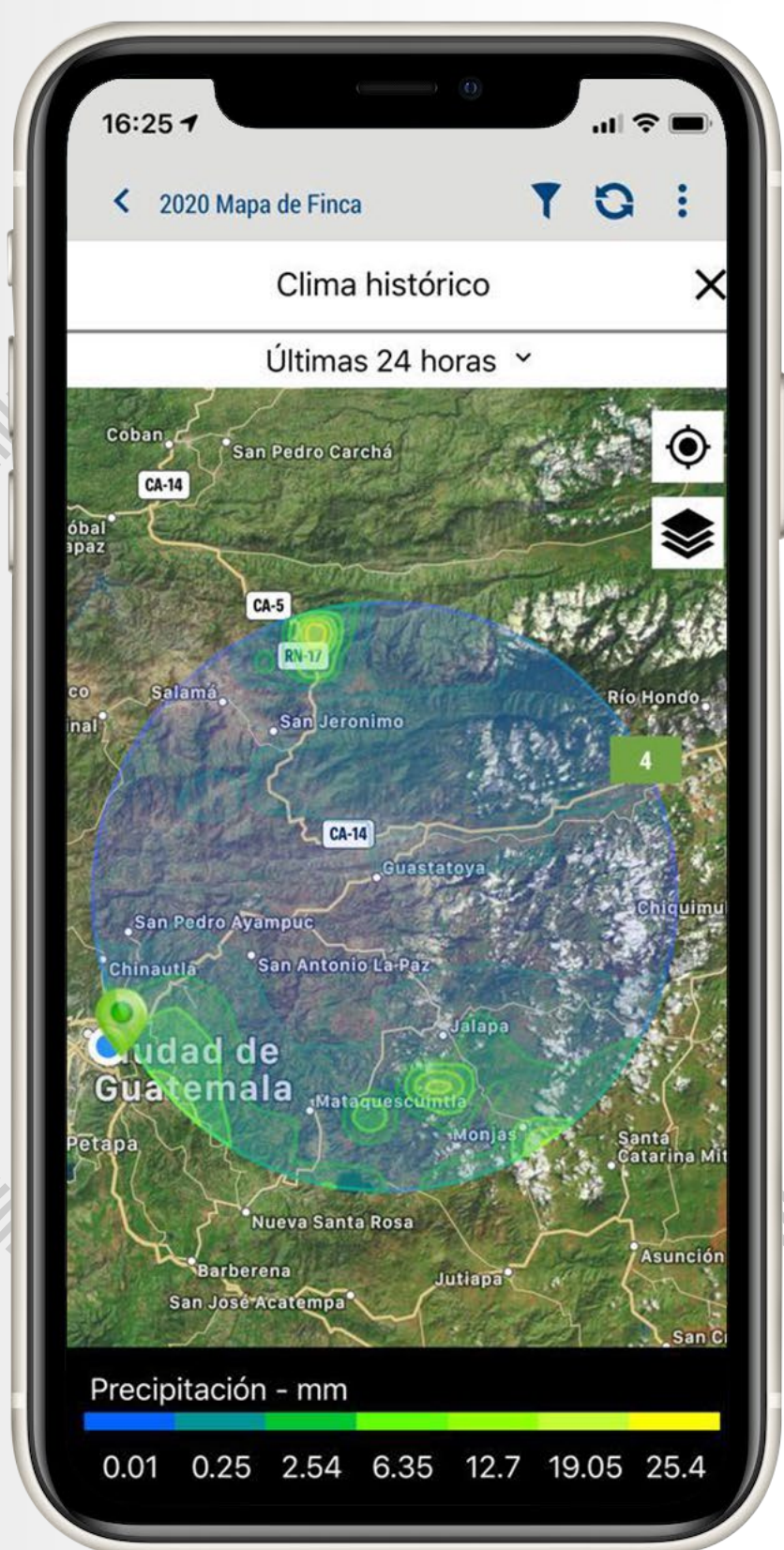
Visualización de clima histórico dentro de AgritecGEO®